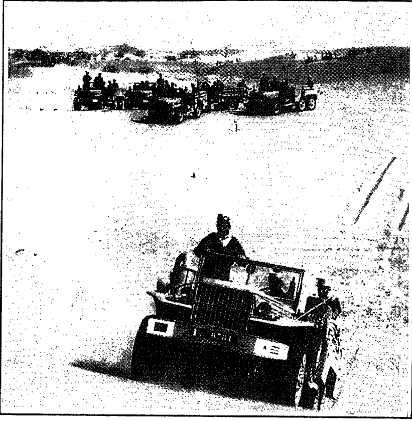
قوة فرنسية في صحراء الجزائر

سنة ١٩٤٥ سيبقى نقطة التحوّل الكبير في تاريخ الثورة الجزائرية الكبرى، وقد كان فعلاً بداية نهاية الإحتلال والخطوة الأولى الكبيرة في مسيرة التحرير والإستقلال.